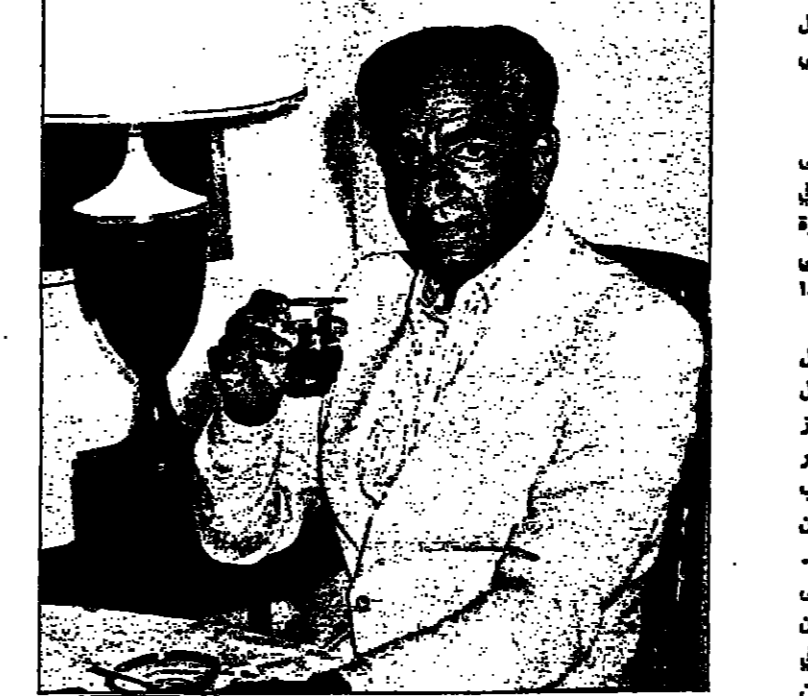
الملك فيصل الثاني ملك العراق

الخطبة حذرة من الخارج : بعد كل هذا ينقل الشاه الى اميركا والى الدور الذي لعبته في طرده من البلاد وفي تروية خصومه فيوجه اليها القوم ببرارة